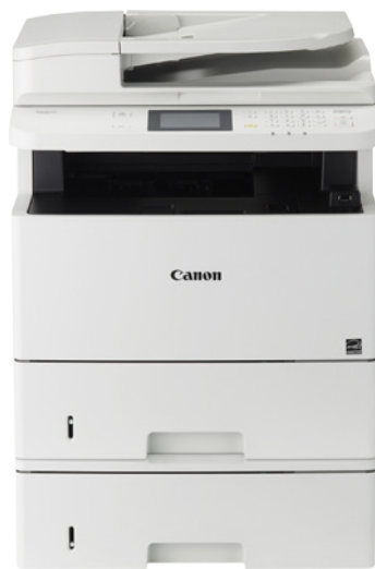
Multifunktionssystem + 1 Papierkassette PF-45